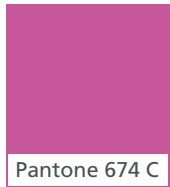
Pantone 674 C